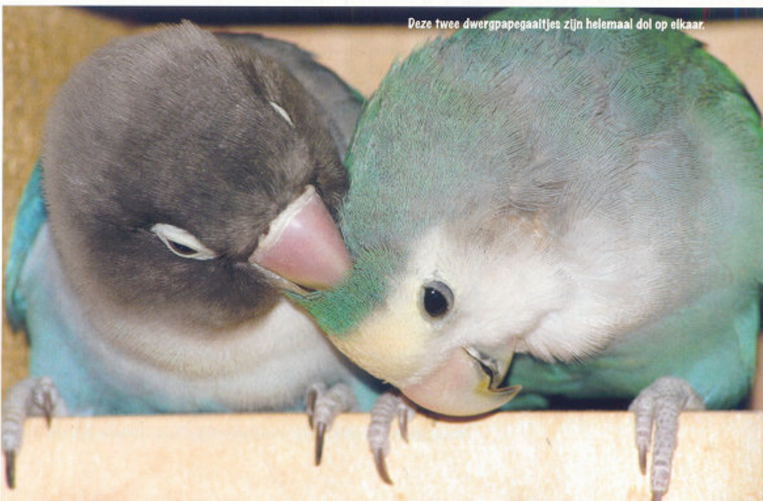
Deze twee dwergpapegaaitjes zijn helemaal dol op elkaar.

van het geslacht kan onder andere bij Gendika (zie kader). Als je verse borstveertjes opstuurt dan kan dat laboratorium via DNA-onderzoek het geslacht bepalen. Doe dit zo snel mogelijk nadat je de nieuwe vogel hebt aangeschaft, want je gaat je heel snel aan hem hechten!