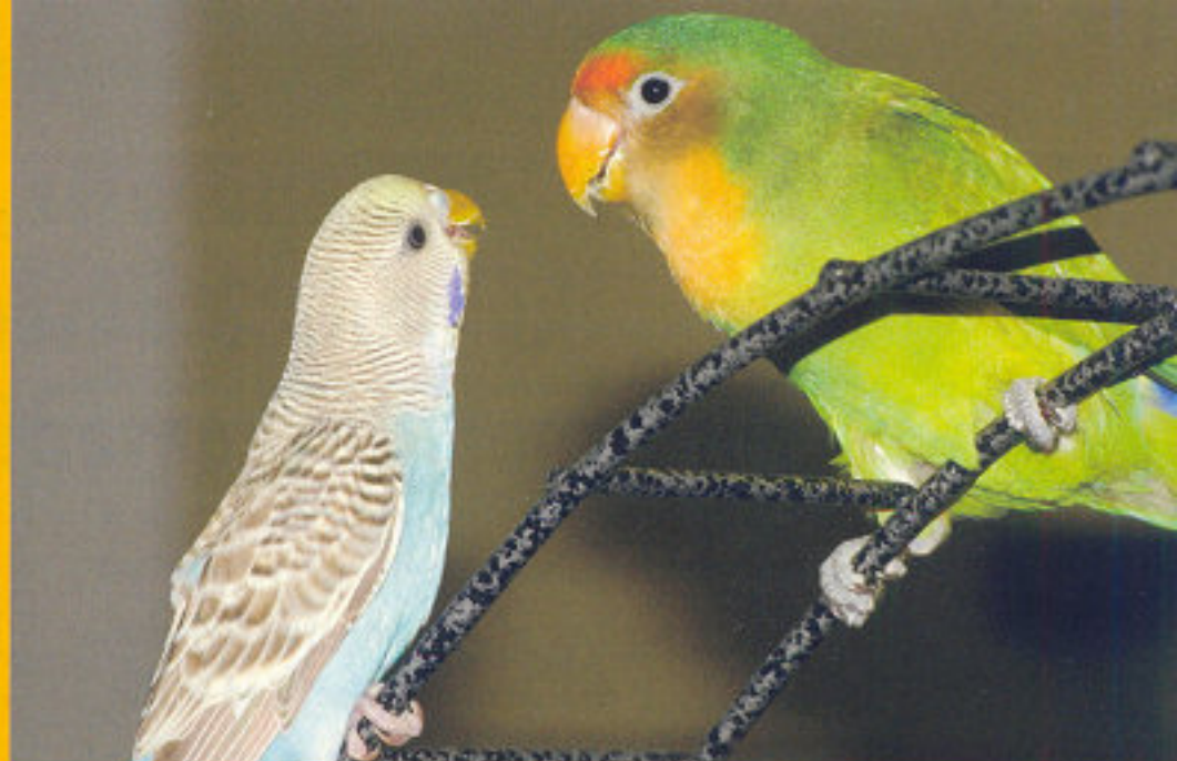
Deze parkiet en agapornis zijn buiten de kooi dikke vriendjes.

Soms lukt het meteen om de tweede vogel direct bij je huidige vogel te plaatsen, maar dan toch is het verstandig een reservekooi bij de hand te houden; plaats de vogels alleen bij elkaar als je erbij bent. Je kan ze dan goed in de gaten houden, en zien hoe ze op elkaar reageren. Soms lijkt het goed te gaan, maar zal de ene vogel dusdanig dominant reageren op de andere vogel, dat het alleen maar stress opwekt bij de nieuweling.