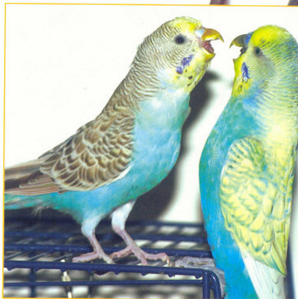
Deze twee parkieten vinden elkaar nog niet zo lief.

Voor je naar de dierenspeciaalzaak snelt om een maatje voor je vogel te gaan halen, zorg je dat je thuis een tweede kooi hebt klaarstaan, die je naast de kooi van je 'oude' vogel zet. De nieuweling kan in eerste instantie namelijk het beste apart gehuisvest worden. Als de kooien naast elkaar staan dan zien en horen ze elkaar, en kunnen ze langzaam aan elkaar wennen. Ze zien van elkaar wat ze doen: eten, drinken, poetsen, kletsen en slapen – en na verloop van tijd gaan ze het gedrag van elkaar overnemen. Als de nieuwe vogel een beetje gewend is aan zijn nieuwe omgeving, kun je beginnen ze samen uit de kooi te laten. Op deze manier kunnen ze elkaar