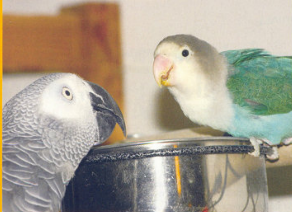
Deze agapornis lijkt aardig gewaagd aan de grijze roodstaart, maar laat dit liever niet toe!